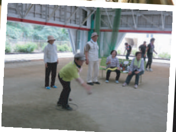
一投入魂！！ ペタンク大会