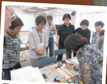
墨彩画の講座を 観て、描いて楽しめました シルバー大学校