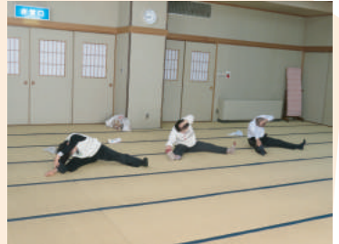
やや強めのハードコース