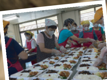
腕によりをかけて届けます 配食サービス