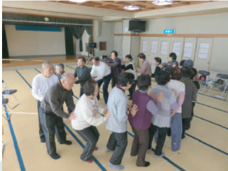
「スリスリマッサージ」で全身を活性化させます