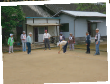
仲間と助け合うスポーツ ゲートボール協会