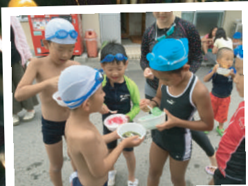
今日は私達が主役☆ こども★さろん