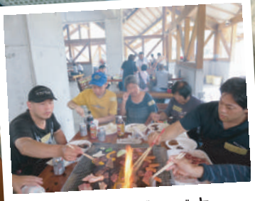
仲間と楽しくバーベキュー ふれあいキャンプ