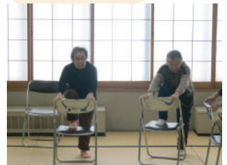
個人の体力に合わせて、 体操やストレッチを行っています。