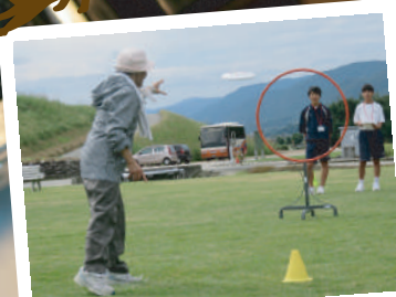
青空にたくさんの ディスクが舞いました フライングディスク大会