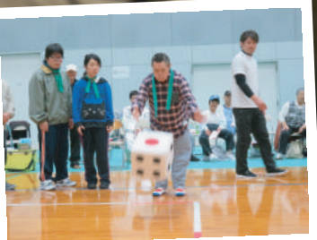
なにができるかな♪ なにができるかな♪ 障がい者合同スポーツ大会