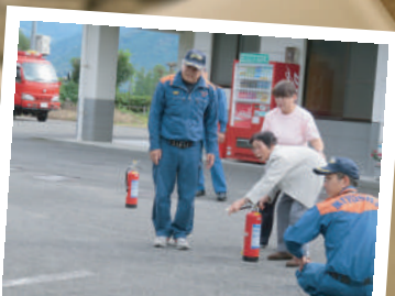
備えて安心、体験して実感 避難訓練