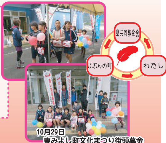
10月29日 東みよし町文化まつり街頭募金

自治会長さまのご協力により平成28年度の共同募金運動はおかげをもちまして12月31日で無事終了しました。上記のとおり、みなさまからご寄付をお寄せいただいておりますのでご報告いたします。みなさまのご協力に心から感謝申し上げます。