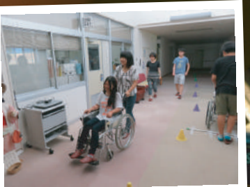
みんなで楽しく学びました ボランティアスクール