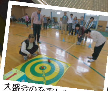
大盛会の充実した 一日でした 老人クラブ体育大会