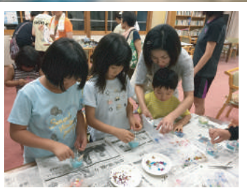
夜の災害に備えます 夜間の防災体験