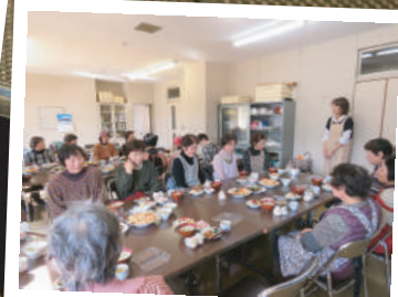
美味しいお弁当を 届けるために 調理講習会