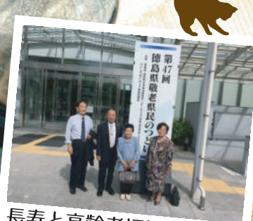
長寿と高齢者福祉の 永年の功績をお祝い 敬老県民のつどい