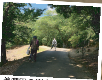
美濃田の淵を きれいにしました 手をつなぐ育成会