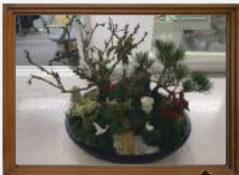
新年を祝う 彩り豊かな盆栽を ご寄付いただきました