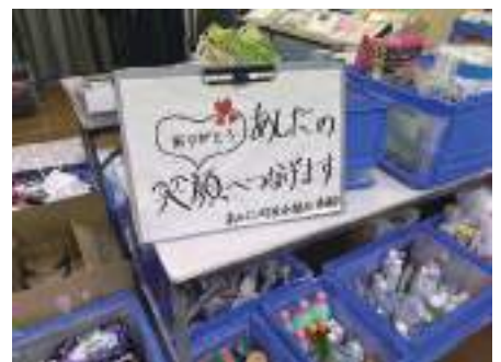
協力いただいた皆様の気持ちをつなげます