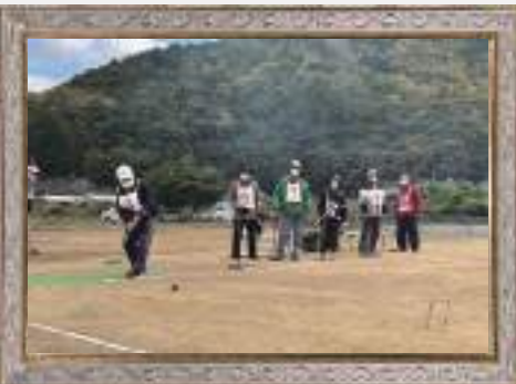
秋季大会では熱のこもった プレーが見られました！ ゲートボール協会