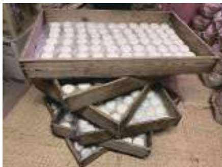
岩野様、ボランティアさんの協力によりお餅も提供しました