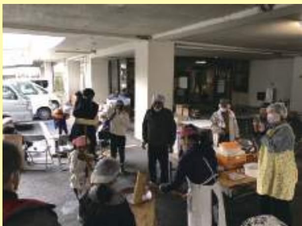
臼と杵を使った昔ながらの餅つきの様子