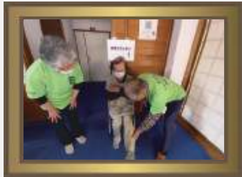
フレイルサポーターが フレイルチェックを 行っています