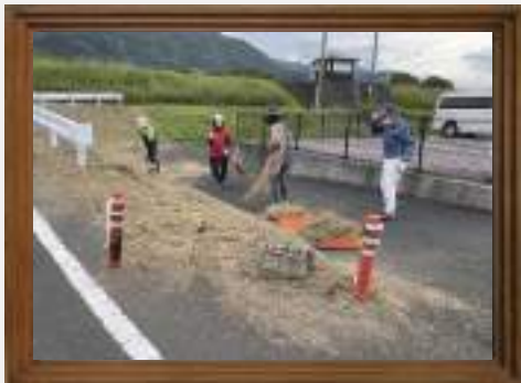
日頃の感謝を込めて、 奉仕作業を行いました シルバー人材センター