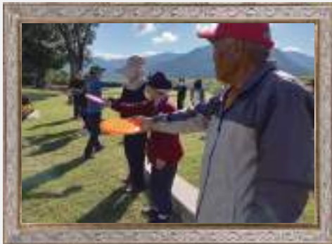
シルバー大学校 健康コースは 大好評です