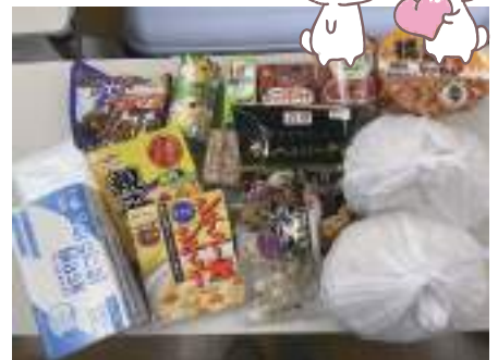
食品や日用品をセットにして提供

ご家庭で余っている食品などを地域の福祉団体やフードバンクに寄付する活動として、フードドライブを平成29年度より実施しています。住民や地域団体の皆さまからの支援を受けながら物品確保に努めています。今後ご協力をお願い致します。