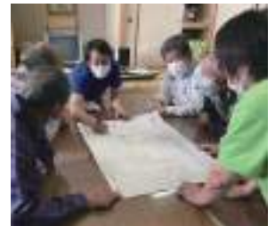
令和4年度さんわ会開催状況