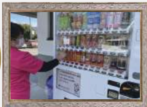
さざんか荘に赤十字 募金型自動販売機が 設置されました