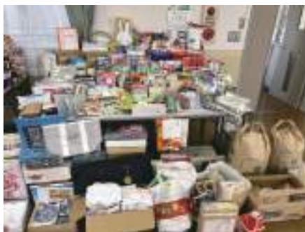
地域の皆さまや消費者協会様より寄付