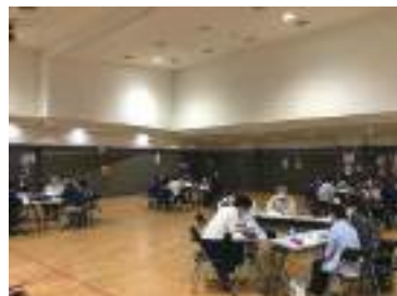
9/20三加茂地区座談会

三加茂地区と三好地区で座談会を開催しました。協議体の推進員さまに参加いただき、運転免許証返納による課題やご近所での見守りについて話し合いました。