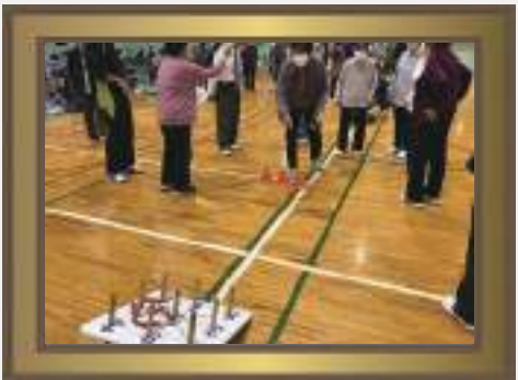
応援にも力が入ります！ 老人クラブ連合会体育大会