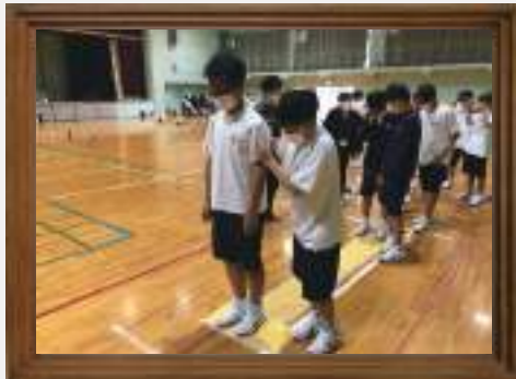
三加茂中学校一年生が 福祉学習で障がい者体験を 行いました