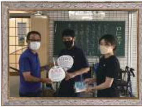
サロン活動で フレイル予防!