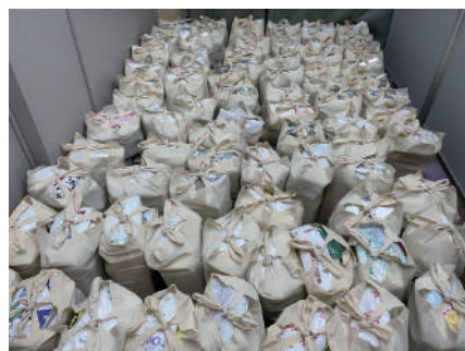
食品や日用品をセットにして提供しました