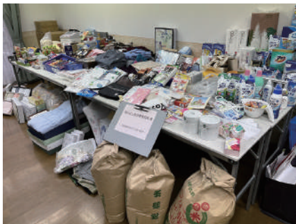
越年支援では地域の皆様や消費者協会様よりご寄付いただいた物品

ご協力 ありがとう ございました 皆様からいただいた 気持ちを大切に 使わせていただきます