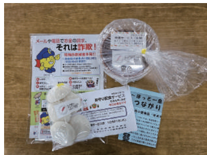
年末にはお味噌とお餅をお配りしました。

問合せ・申込先 東みよし町社協 地域福祉課 (TEL 0883-82-6309)